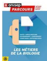
Parcours les métiers de la biologie