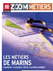
Zoom les métiers de marins